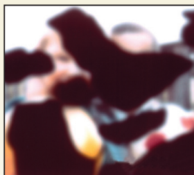
La visión con la Retinopatía Diabética